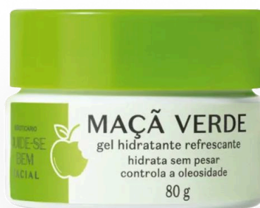
Gel Hidratante Refrescante Cuide-se Bem Feira Maçã Verde

Essa etapa mantém a barreira natural da pele protegida, equilibra a oleosidade em adolescentes com esse tipo de pele e previne o ressecamento.