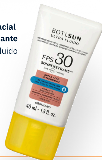
Protetor Solar Facial Antioxidante Boti.Sun Ultra Fluido

O uso diário de protetor solar evita danos à pele. Para exposição prolongada como mar, piscina e atividades ao ar livre, prefira opções resistentes à água. A reaplicação é essencial!