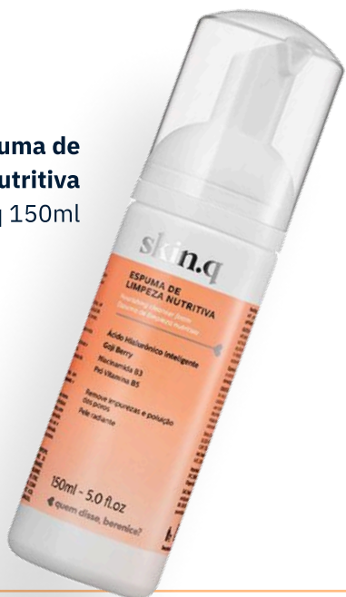
Espuma de Limpeza Nutritiva Skin.q 150ml

O ideal é usar produtos suaves para tirar as impurezas e, em adolescentes, a oleosidade excessiva.